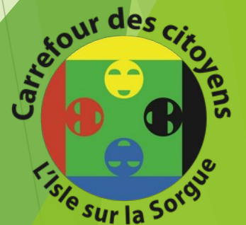
Table ronde Bien vieillir!