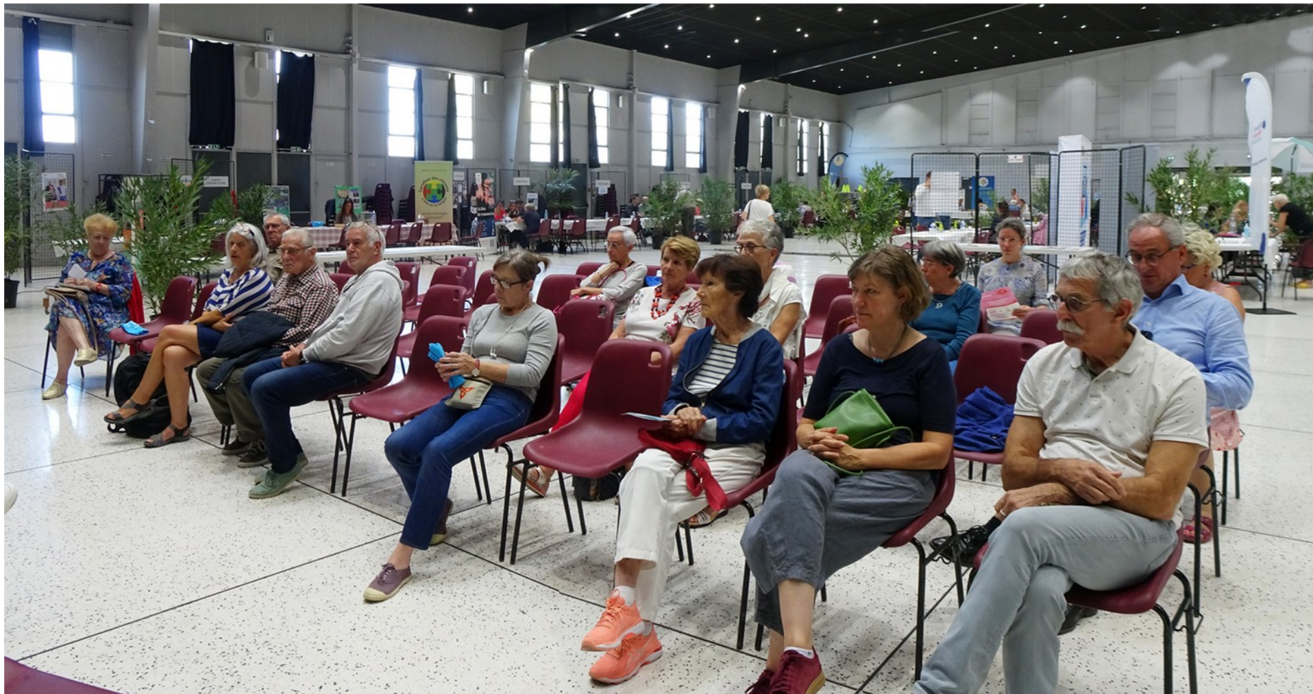
Animation de la table ronde sur le bénévolat